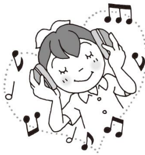
すきな音楽をきこう