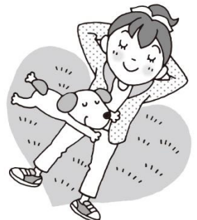
のんびりすごしてみよう