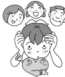
まわりの人に相談しよう