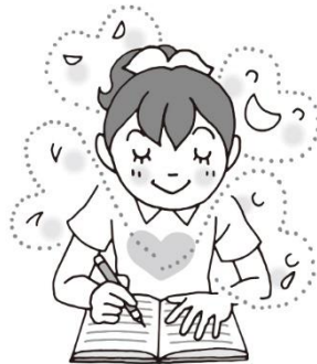
きもちをかきだそう