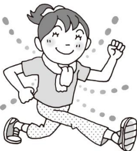
からだをうごかそう